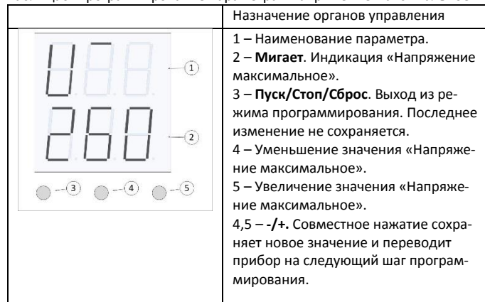
Таблица6. Программирование параметра «Напряжение максимальное».